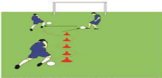
Gambar 1.15. Menggiring dan menendang bola ke gawang.