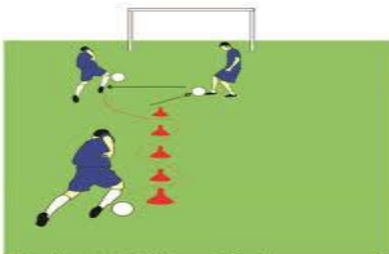
Gambar 1.15. Menggiring dan menendang bola ke gawang.