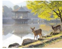
Rusa di taman Nara